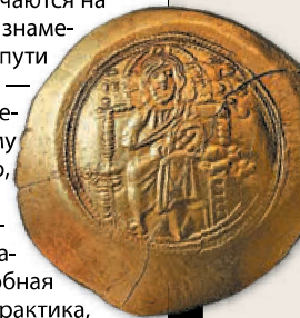
12